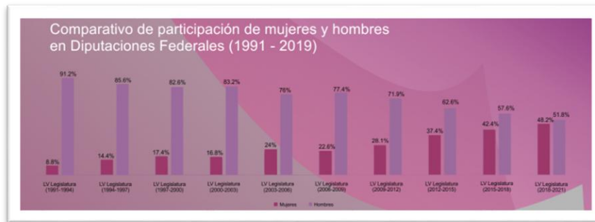
Figura 1: Participación legislativa de la mujer en cifras